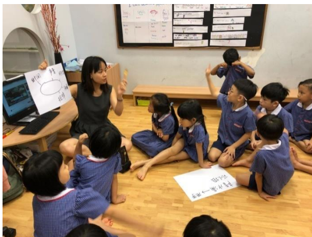
（图 1）播放完两段音频后，教师与幼儿展开讨论。

（2）教师重复问题“你听到什么”并且把幼儿回答的重点记录下来（图 1）。如果幼儿需要更多的提示，教师可以再次播放水滴的视频，并且鼓励幼儿跟着水滴声拍掌。这主要是引导幼儿发现这些声音是有规律，为在之后引出“节拍”的概念作铺垫。